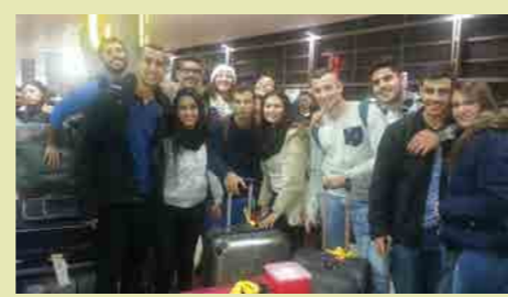
המשלחת לפולין, בשדה התעופה