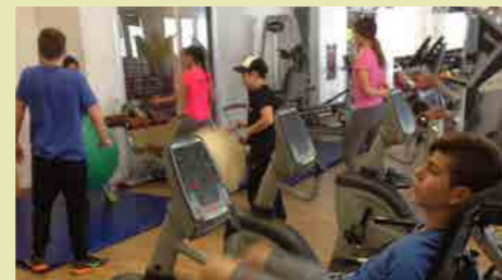
התמחות חינוך גופני מתאמת מס' פעמים בשנה בקאנטרי אריאל.