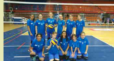
נבחרת הכדורעף שלנו המורכבת מבנות ז-ח-בני שפירו, בין 6 הקבוצות המובילות במחוז