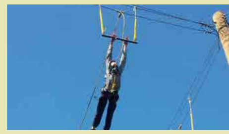
פעילות שכבה י' בפארק לפיתוח מנהיגות